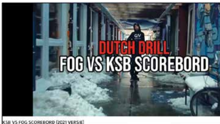
Afbeelding 3.1 Voorbeeld van een scoreboard

Afbeelding 3.1 geeft het beginbeeld weer van een YouTube-video van 29 april 2021 waarin de scores van KSB en FOG (drillrapgroepen uit Amsterdam) op een rij worden gezet. In deze video komen de volgende teksten voor: ‘VL steekt Y.RS. Punten: 1’ en ‘RS gekilled door Wouter 22. Punten: 3’.